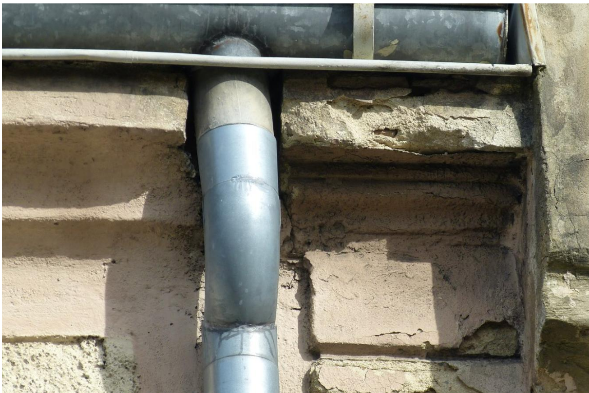
Fot. 4. Wnęka za spustem rynny - siedlisko nietoperzy.