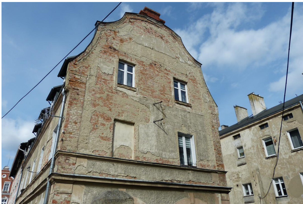
Fot. 2. Inwentaryzowany budynek.