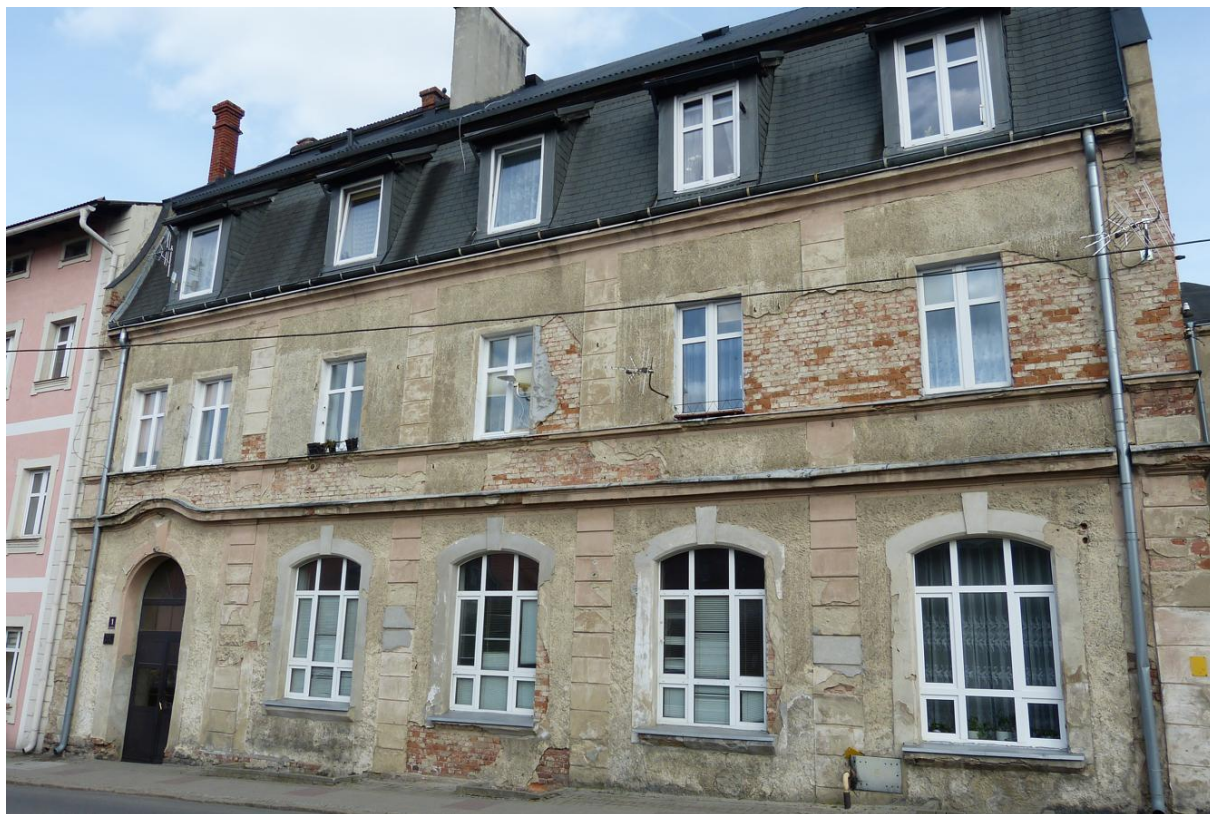
Fot. 1. Inwentaryzowany budynek.