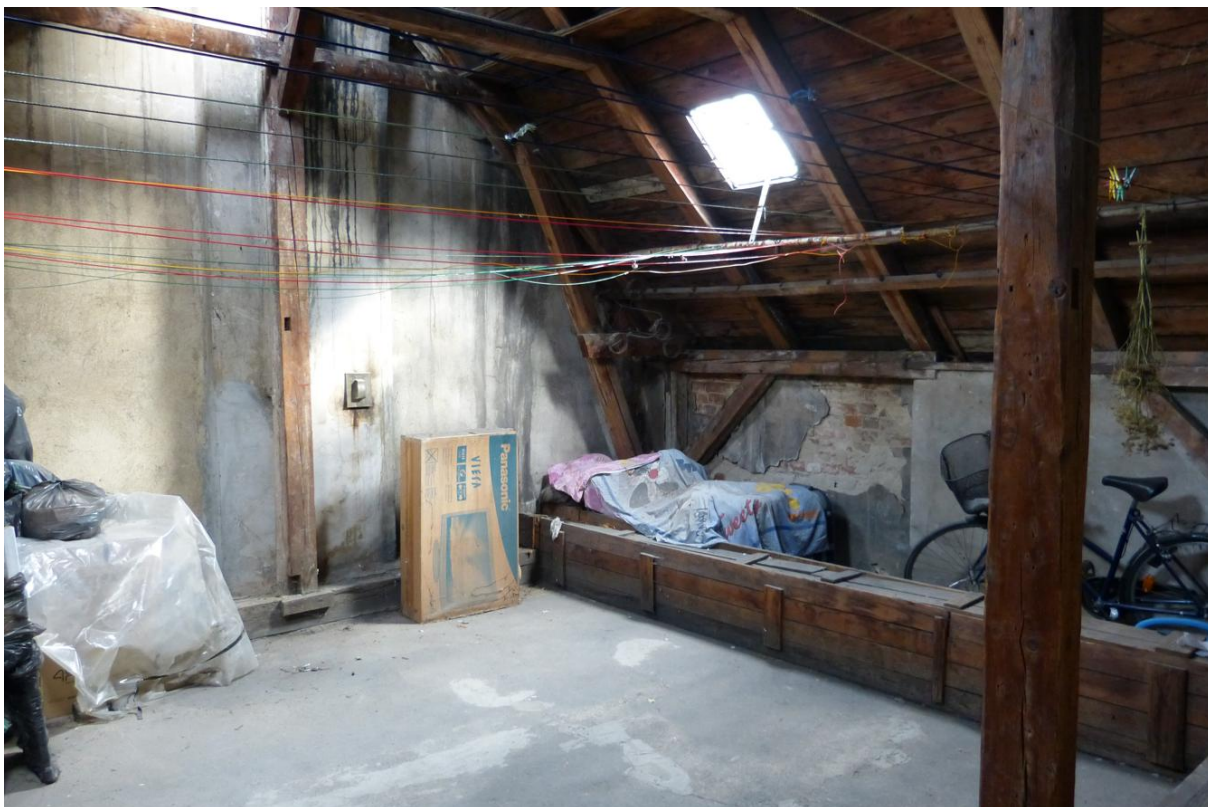
Fot. 3. Strych inwentaryzowanego budynku.